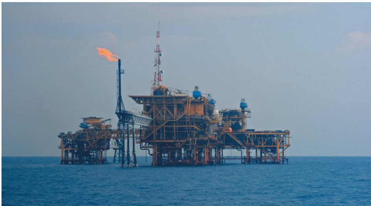
中海油在印尼的作业平台