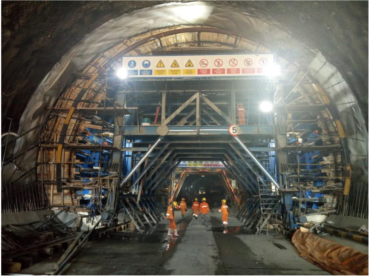
雅万高铁施工现场