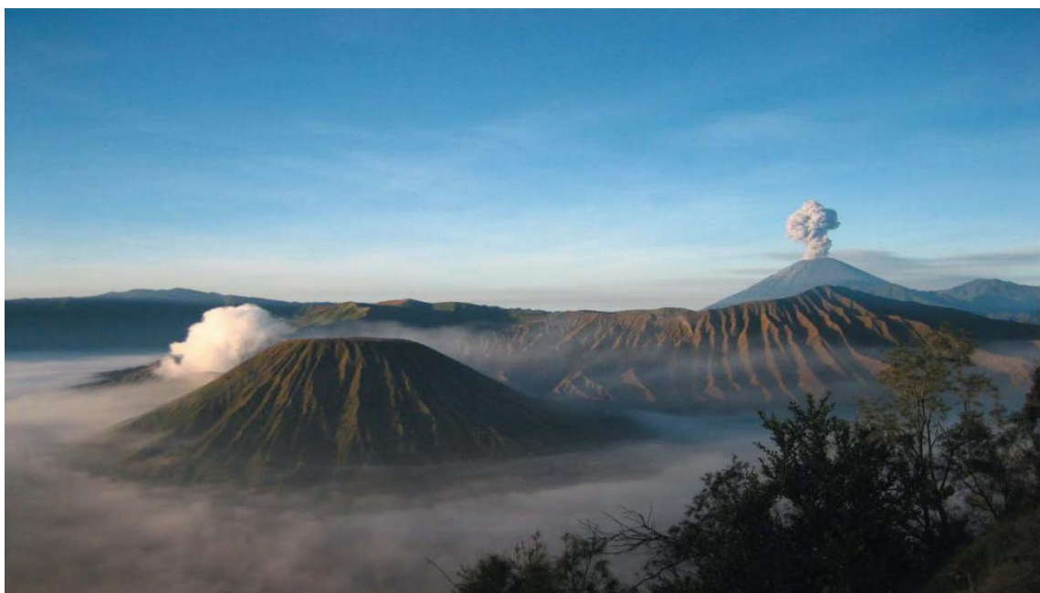
印尼著名的活火山—BROMO火山

印度尼西亚（以下简称印尼）位于亚洲东南部，由太平洋和印度洋之间的17508个大小岛屿组成，是世界上最大的岛国、最大的群岛国家，国土面积191.4万平方公里，海洋面积316.6万平方公里（不包括专属经济区）。包括苏门答腊岛、爪哇岛、苏拉威西岛以及婆罗洲和新几内亚的部分地区。与巴布亚新几内亚、东帝汶、马来西亚接壤，与泰国、新加坡、菲律宾、澳大利亚等国隔海相望。