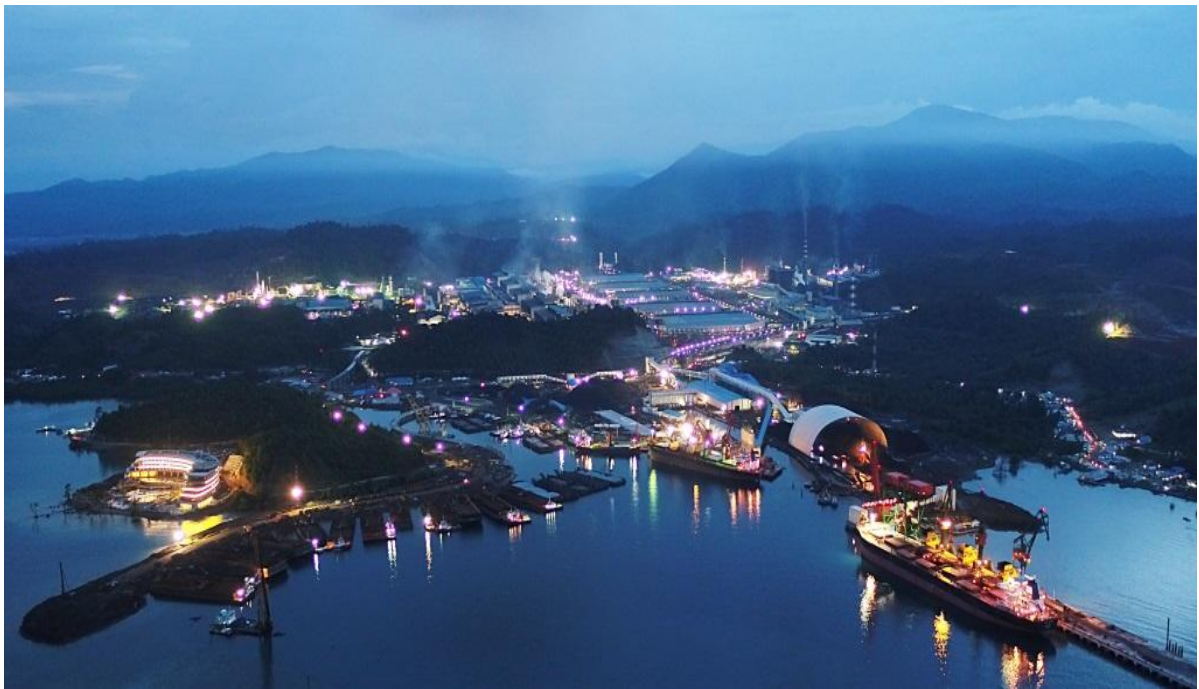
中国企业在印尼投资的青山工业园