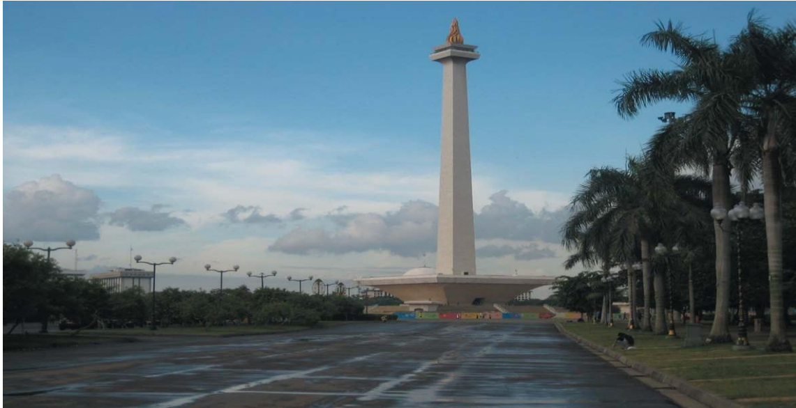
印尼独立纪念碑广场

印尼实行总统制，总统既是国家元首，也是政府首脑，同时掌管三军。总统、副总统均由全民直选产生，任期5年，总统可连任一次。现任总统为佐科·维多多，副总统为马鲁夫·阿敏，本届内阁于2019年10月组建，任期至2024年。