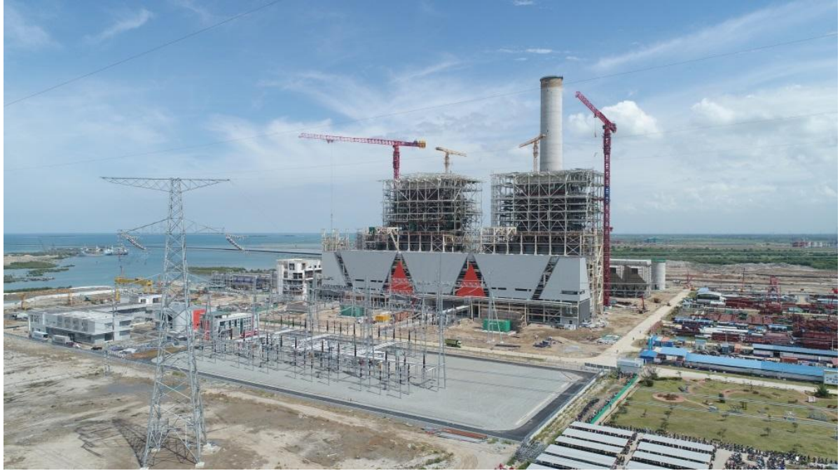
华国华印尼爪哇7号项目